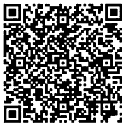
技術簡介及專利說明