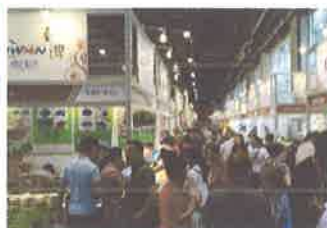
第 25 屆廣州台博會-現場實況