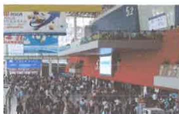
第 24 屆廣州博覽會-現場實況