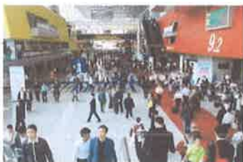
第 25 屆廣州台博會-現場實況