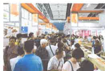
第 24 屆廣州博覽會-現場實況